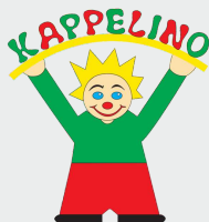
Kinder- und Familienzentrum

Kinder- und Familienzentrum Kappelino im Mehrgenerationenhaus Chemnitz Irkutsker Straße 15 • 09119 Chemnitz Tel. +49 371 - 400 76 22 Fax +49 371 - 400 76 23 kifaz@solaris-fzu.de www.solaris-fzu.de